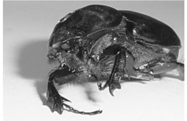
Elämä ei ole mielikuvitusmatka.

Silmiä polttaa jumalattomasti. Ne ovat aivan kuivat. Väistämätön tapahtuu. Yritän pinnistellä vielä hetkisen. Viimein räpäytän. Saatan kuulla ripsien aiheuttaman kohahduksen. Se villiintyy ja sulkee silmänsä voitonriemuisena. En pysty ymmärtämään. Ei taas! Jo liian mones hävitty erä. Se katselee minua piinaavan hillittynä. Se saa hermoni. Minä, raunio.